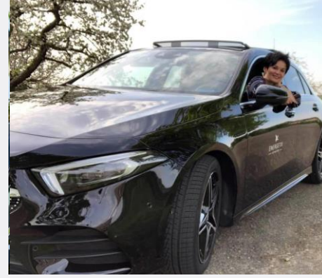
Auto-Programm mit Mercedes