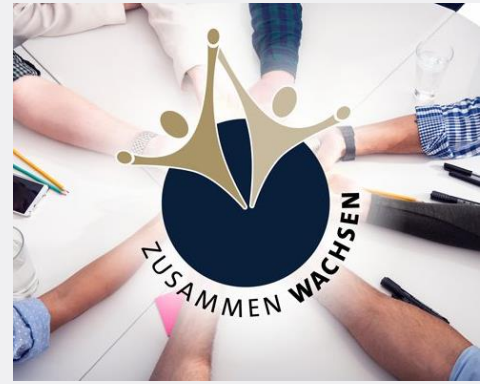
Wachstum – Persönlich und im Team