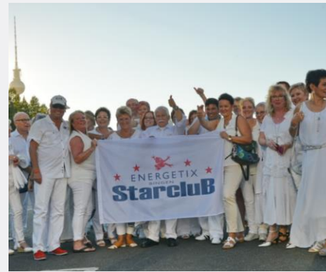
Der ENERGETIX STARCLUB