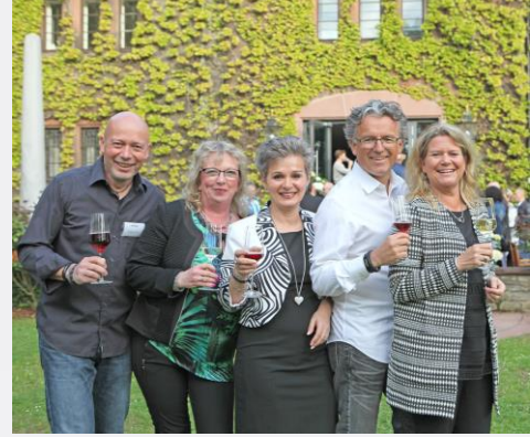
Spaß mit deinen neuen Kollegen