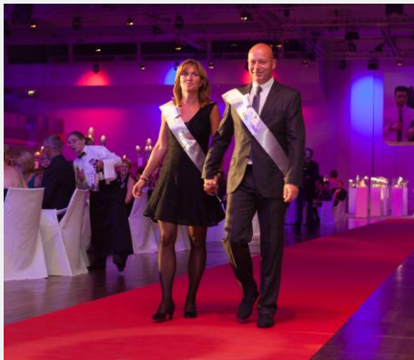
Wertschätzung und Anerkennung